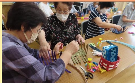
☆カゴ作りに全集中☆

西海地域下久家地区の『笑、笑』は、今年4月に新しくできたサロンです。地域の人が楽しく集える場所を作りたいという思いで、新設されました。3回目となる今回は、カゴ作りを行いました。土台部分だけ先に作っておき、会員さんは側面だけ編んでいくように準備されました。初めてカゴ作りをする人も多く、皆さん真剣な面持ちで編んでいました。カゴ作りの最中、会員さんが元気な声で話す姿が見られ、「明るく楽しいサロンだな」と感じました。