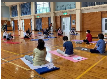
真向法体操でいい汗

今年度初の代表者会を六月十七日に開催しました。 代表者会では、サロン交流会の報告、サロンごはん販売のお知らせ等のお話しをしました。サロン交流会に興味を持ってくださるサロン代表者さんも多く、これからの交流が楽しみです。 そして、メインイベントと言っても過言ではない、松野町サロン視察研修も同日に行いました。今回は松野町サロン『パワーズ』に教わりながら、真向法体操をしました。皆さん体操しながら、楽しい汗を流していました。後日、ある代表者さんからは「体が軽くなり、楽になった」という声も頂き、効果抜群だったようです。『パワーズ』には愛南町のサロン代表者さんと知り合いの方もおり、久しぶりの旧友との再会に喜びました。 その後、松野町サロン×愛南町サロンの代表者のモルック大会を実施しました。皆さん、モルックに関心を持たれていたようで、白熱した試合になりました。今回の研修を活かし、楽しく健康的なサロンづくりに繋げていけると良いですね。